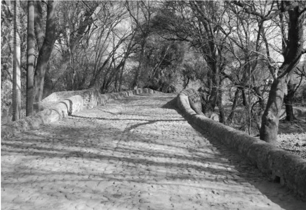
Hidalgo, tronçon du Camino Real entre le pont de La Colmena et l'ancienne hacienda de La Cañada