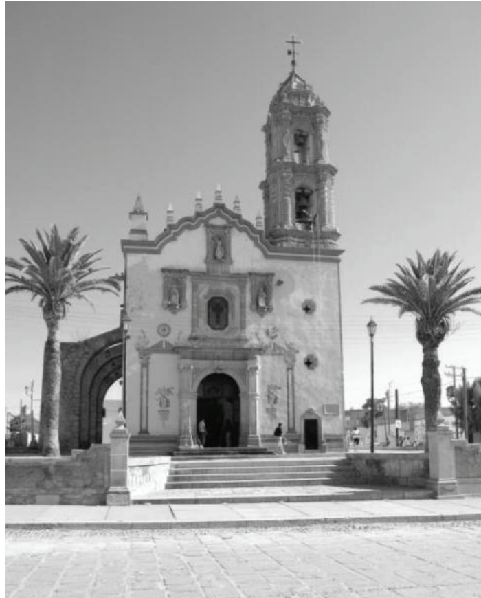
Aguascalientes, ancienne hacienda de Pabellón de Hidalgo