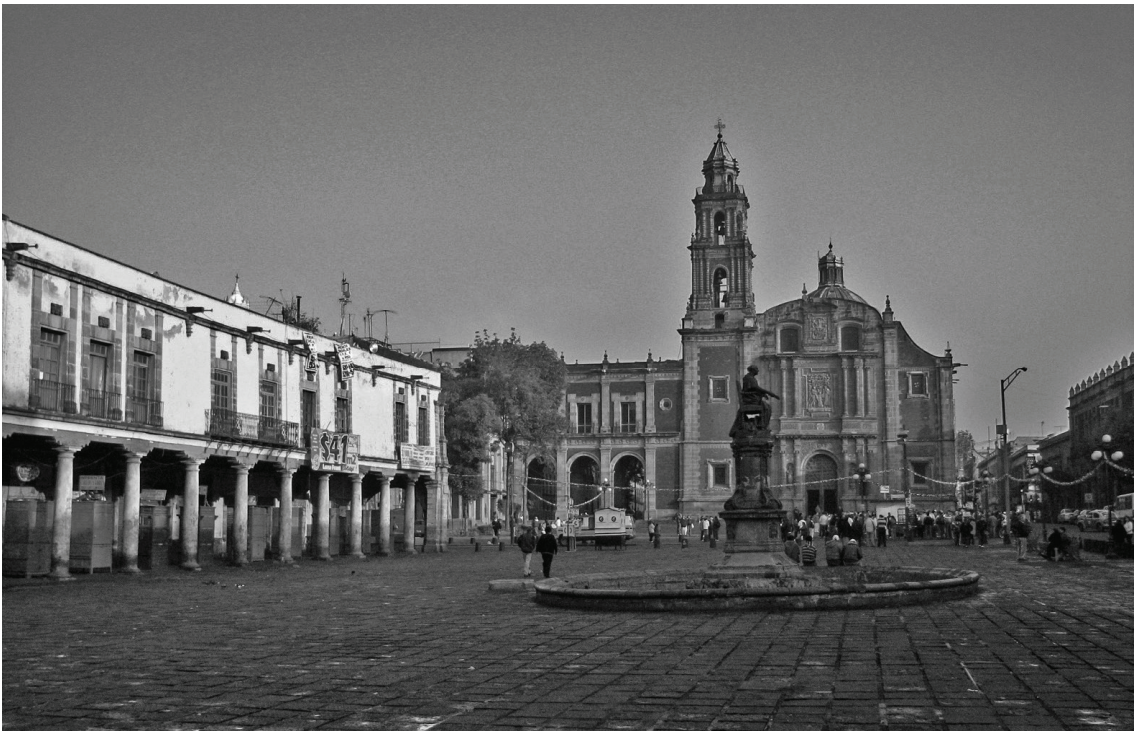
Centre historique de Mexico, église et place de San Agustín