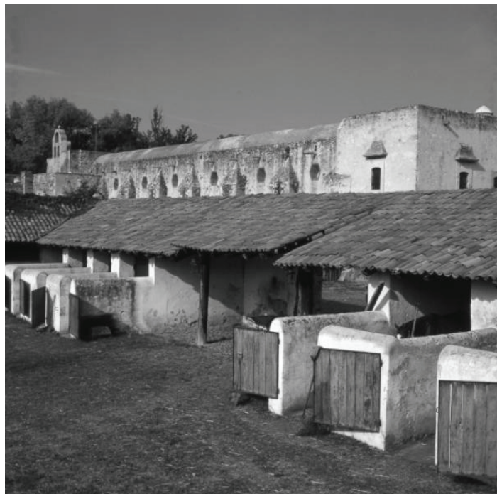
Querétaro, ancienne hacienda Chichimequillas