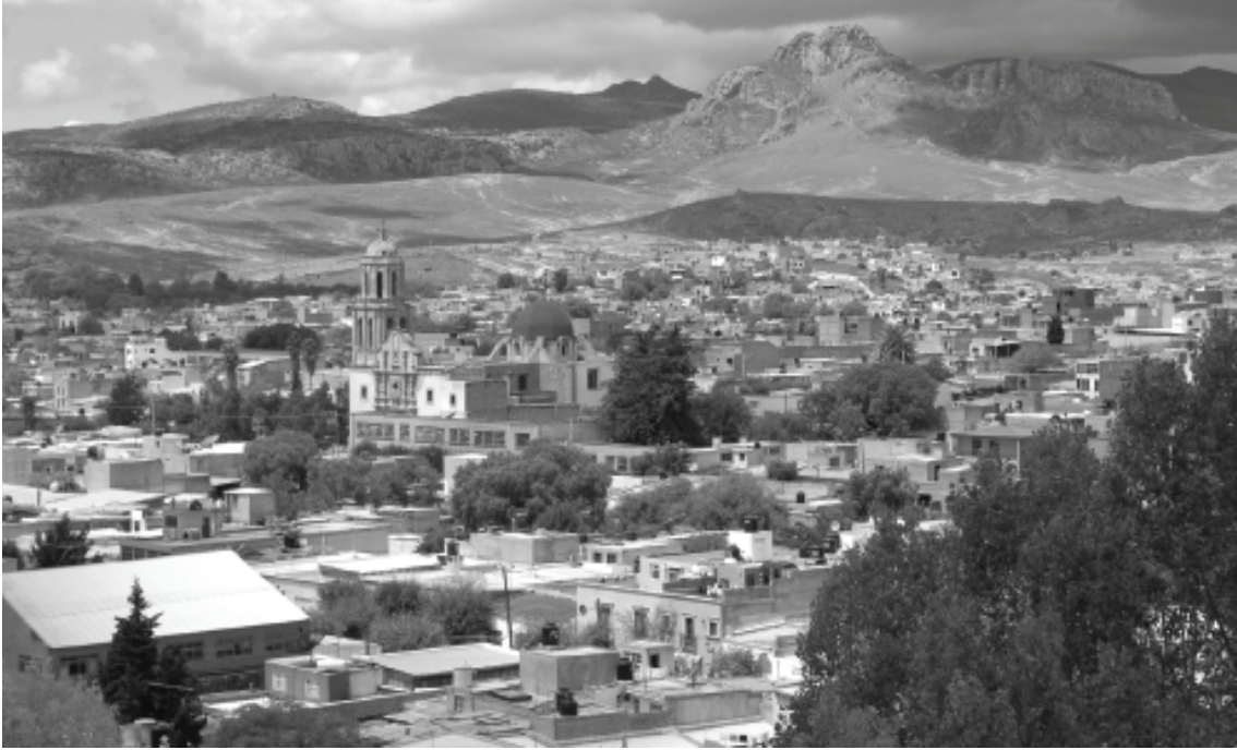
Zacatecas, ensemble historique de la ville de Sombrerete