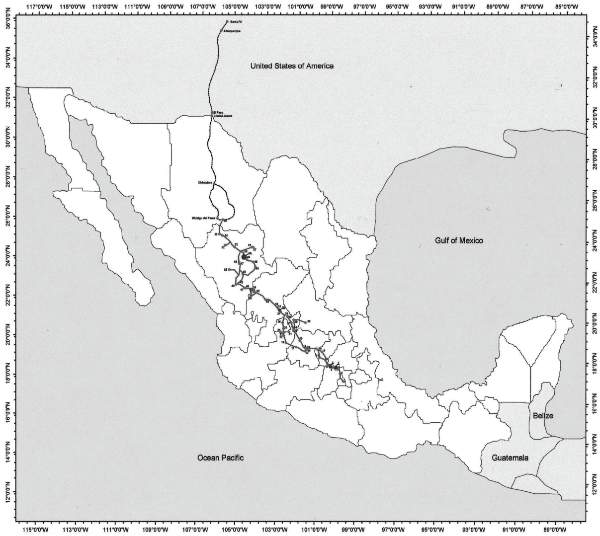
Carte indiquant la localisation des biens proposés pour inscription