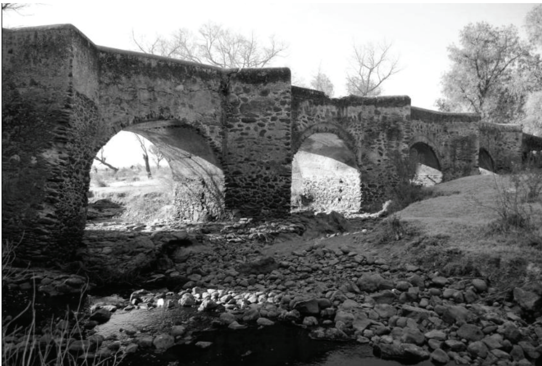
Guanajuato, pont La Quemada